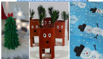
Slika 3: Enostavni božični izdelki ( https://maribor24.si/wp-content/uploads/2020/12/130873444_3554740367944482_8981798462218480227_o-1-778x438.jpg )