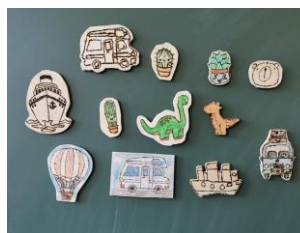
Slika 2: Okrasni magnetek ( https://tehnikaitezakon.si/wp-content/uploads/2022/06/leseni-magnetki.jpg )