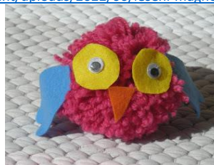
Slika 4: Figurice iz cofkov ( http://3.bp.blogspot.com/-P3pO2QjOSak/T6LfagogFhI/AAAAAAAAAQ0/zz5Gu9d0AeM/s320/Maj+024.jpg )