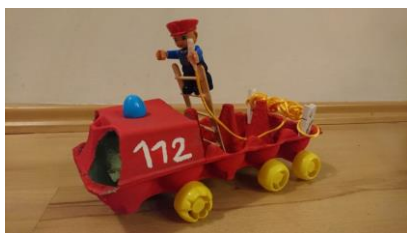
Slika 1: Gasilski avto ( https://www.askerc.si/files/2021/01/Zoja-Dobl%C5%A1ek-2-1024x576.jpg )