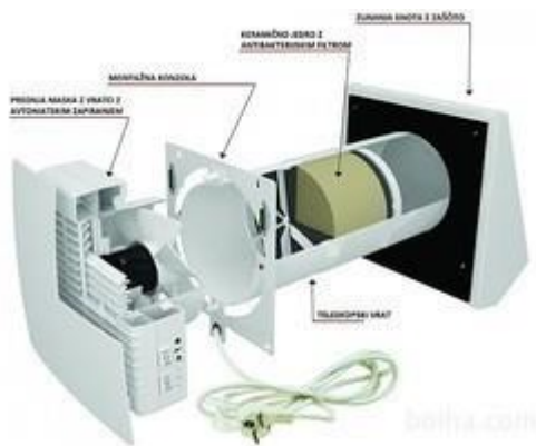
Lokalni oziroma prostorski prezračevalnik z

Sistem prezračevanja poleg prenosnika sestavljajo še dva ventilatorja, kanali in rešetke ter zračni filtri, skozi katere potujeta oba zračna tokova. Na strani vstopnega zraka je vgrajen še sistem zaščite pred zmrzovanjem, na poti ohlajenega zraka pa je nameščen lovilec izločene vodne pare. Delovanje naprave oziroma ventilatorjev ureja regulacijska enota s tipali.