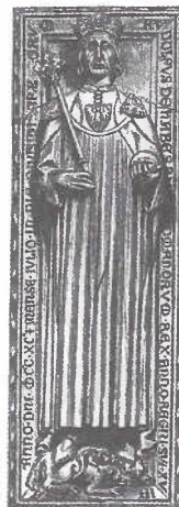
Rudolf I. Habsburški (1218-1291)