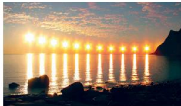
Na tečaju Sonce pol leta ne zaide.

Severni tečajnik je vzporednik, ki leži 66,5° severno od ekvatorja in omejuje območje okrog tečajev, kjer Sonce vsaj enkrat v letu ne vzide oziroma zaide. Z oddaljevanjem od tečajnika proti severu se čas, ko Sonce ne vzide oziroma zaide, podaljšuje. Na tečaju Sonce pol leta ne zaide oziroma vzide. Ta pojav imenujemo polarni dan oziroma polarna noč . Polarna noč predstavlja posebno težavo v Severni Evropi, saj zimsko pomanjkanje dnevne svetlobe slabo vpliva na ljudi.